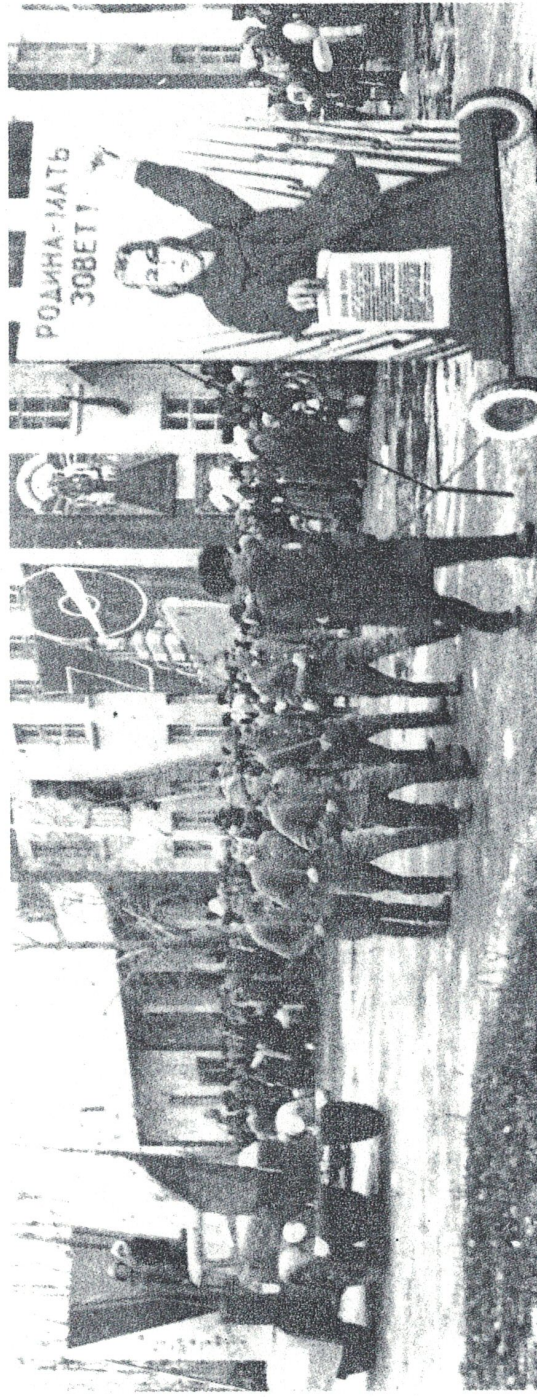
Праздничная демонстрация. Нововаршавка. 1987 г.